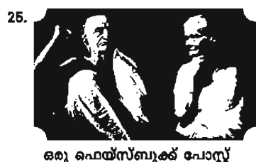
ഒരു ഫെയ്സ്ബുക്ക് പോസ്റ്റ്

24. 'ഈശോ എന്നിക്ക് ആരാണ്?' 10 വർഷത്തെ വിശ്വാസപരിശീലനത്തിന്റെ വെളിച്ചത്തിൽ, കുടുംബത്തിൽ നിന്ന് ലഭിച്ച വിശ്വാസചൈതന്യത്തിന്റെ നിറവിൽനിന്ന് നിങ്ങളുടെ വ്യക്തിപരമായ ബോധങ്ങളും അനുഭവങ്ങളുമൊക്കെ വിവരിച്ച് പ്രസ്തുത ചോദ്യത്തിന് ഉത്തരം നൽകുക.